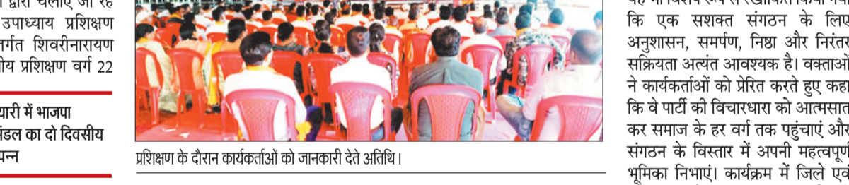
प्रशिक्षण के दौरान कार्यकर्ताओं को जानकारी देते अतिथि।

भारतीय जनता पार्टी द्वारा चलाए जा रहे पंडित दीनदयाल उपाध्याय प्रशिक्षण महाभियान के अंतर्गत शिवरीनारायण मंडल का दो दिवसीय प्रशिक्षण वर्ग 22