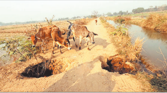
करनौद स्थित नहर टूटने से बने गड्ढे।