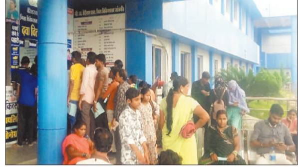
जिला अस्पताल के बाहर दवा लेने के लिए लगी मरीजों की लाइन।