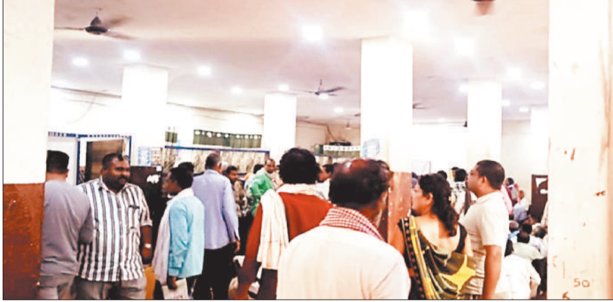
जिला सहकारी बैंक में राशि पाने लगी किसानों की भीड़।

गौरतलब है कि जांजगीर चाम्पा जिले के सबसे बड़े जिला सहकारी बैंको में से एक जांजगीर में अपनी ही जमा राशि निकालने को लेकर किसान इन दिनों कड़ी मशक्कत करते देखे जा रहे हैं। किसानों की सुविधाओं को ध्यान में रखकर अलग अलग दिनों के हिसाब से राशि आहरण को लेकर व्यवस्था बनाई गई है, ताकि किसानों को राशि निकालने को लेकर किसी तरह की कोई परेशानी ना हो। वही दुसरी ओर किसान सुबह से शाम तक कतार में लगने के बाद भी पैसे नहीं निकाल पाते एवं कई बार तो मायूस होकर अपने घर लौट जाते हैं। जिला सहकारी बैंक जांजगीर में करीब 23 हजार से भी अधिक खाता धारकों की संख्या है। इनमें बड़े पैमाने पर किसानों के द्वारा