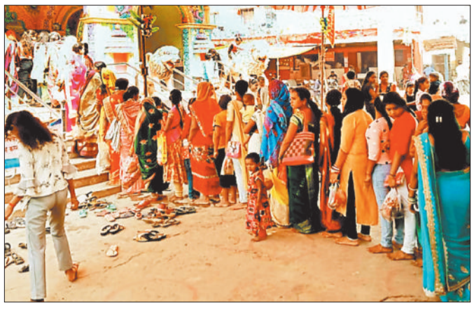
खोखरा स्थित मां मनकादाई मंदिर में दर्शन के लिए लगी भक्तों की कतार।

नवरात्रि पर्व के अष्टमी के दिन महागौरी की पूजा-अर्चना की गई। इस दौरान मंदिरों में सुबह से ही श्रद्धालुओं की भारी भीड़ देखी गई। जिले के चंद्रहासिनी, अष्टभुजी, मनका, महामाया सहित अन्य देवी मंदिरों में भक्तों की लंबी कतारें देखने को मिली। देवी-मंदिरों में पुड़ी-हलवा का भोग लगाया गया। भक्तों द्वारा माता के मंदिरों में लाल जोड़े चढ़ाये गये। कई जगहों पर हवन के साथ कन्याभोज का आयोजन भी हुआ।