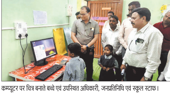
कम्प्यूटर पर चित्र बनाते बच्चे एवं उपस्थित अधिकारी, जनप्रतिनिधि एवं स्कूल स्टाफ।

आयोजन भी हुआ। अष्टमी तिथि पर देवी मंदिरों में सुबह 4 बजे से देर रात तक भक्तों का तांता लगा रहा, जिसमें महिलाओं की विशेष भीड़ देखी गयी। इसी तरह हरदी के महामाया में भक्तों की भीड़ लगी रही। जनश्रुति के अवसर पर मां भवानी अपने वाहन शेर पर सवार हो मध्यरात्रि में अपने विग्रह में प्रवेश करती है। ग्राम महंत के चण्डी दाई मंदिर में रात्रि भर जसगीत का दौर चलता रहा। अपनी-अपनी श्रद्धा के अनुरूप भक्तगण कुछ जमीन पर लोट मारते हुए तो कोई पदयात्रा करते हुए आते हैं। देवी मंदिरों में कहीं देवी भागवत रामायण के नवहन परायण, तो कहीं दुर्गा सप्तशती के सामूहिक परायण का विधान अपनाया गया, परन्तु जसगीत का आयोजन सभी मंदिरों में विशेष रूप से किया गया। महाअष्टमी पर जगह-जगह कुंवारी कन्याओं को भोजन कराया गया।