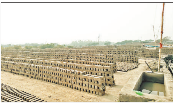
अवैध रूप से संचालित ईट भट्टों।

गौरतलब है कि क्षेत्र के कनकपुर, परसापाली और कपिस्टा क्षेत्र में इन दिनों नियम-कानूनों को ताक पर रखकर अवैध ईट भट्टों का कारोबार फल-फूल रहा है। आलम यह है कि इन तीन गांवों और इनके आसपास के इलाकों में तीन दर्जन