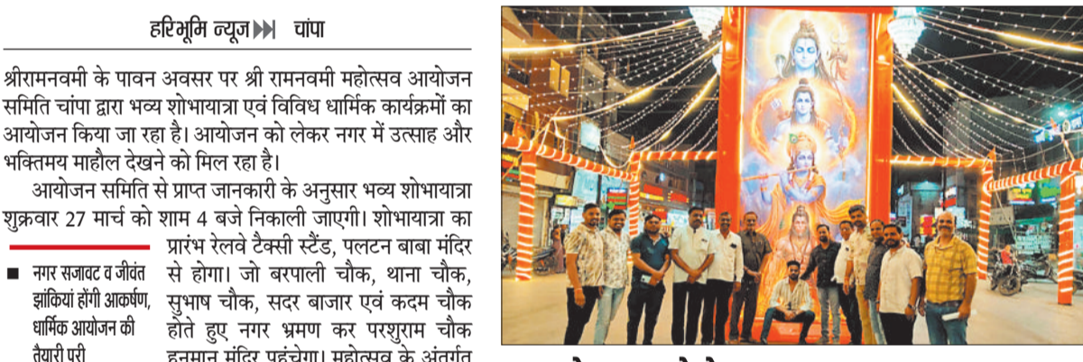
भव्य शोभायात्रा को लेकर नगर हुआ भगवान

नगर में श्रीरामनवमी के पावन अवसर पर निकलने वाली भव्य शोभायात्रा को लेकर जबरदस्त उत्साह देखा जा रहा है। नगर के सभी रामभक्तों ने मिलकर पूरे शहर को भगवा तैरणी और झंडों से आकर्षक रूप से सजाया है। मुख्य मार्गों से लेकर हर गली-मोहल्ले, चौक-चौराहों और खेमें तक भगवामय वातावरण नजर आ रहा है। शोभायात्रा की भव्यता को देखते हुए नगर में धार्मिक उत्साह और आस्था का माहौल बन गया है। सजावट, झांकियां और रामभक्ति से ओतप्रोत वातावरण इस शोभायात्रा को विशेष और आकर्षक बनाने वाला है। नगरवासी पूरी श्रद्धा और उत्साह के साथ इस आयोजन की तैयारियों में जुटे हुए हैं। आयोजन समिति ने नगर सहित आसपास के क्षेत्र के श्रद्धालुओं से अपील की है कि वे अधिक से अधिक संख्या में श्रीराम नवमी के उपलक्ष्य में निकलने वाली इस भव्य शोभायात्रा में शामिल होकर धर्म और आस्था के इस पर्व को सफल बनाएं। समिति ने सभी से आयोजन के दौरान शांति, अनुशासन और आपसी सौहार्द बनाए रखने का भी आग्रह किया है।